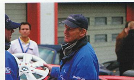
DE & UK: Pistenclub Inside 01/2011